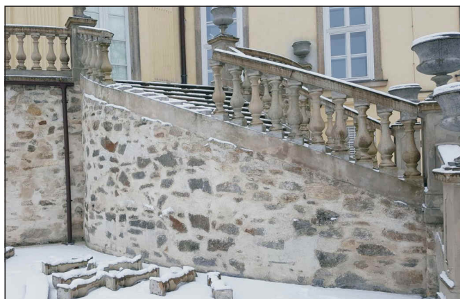
Zabradlí balustrády novohradského zámku

Každý, kdo respektuje pravidla slušného chování v parku i v přírodě, a možná sem tam i uklidí nějakou tu láhev nebo plechovku od různých nápojů, i když ji sám neodhodil, JE SRDEČNĚ VÍTÁN.